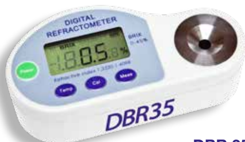
DBR 35 DBR 45 DBR Salt

DBR la serie di rifrattometri a lettura digitale ideale per il laboratorio e la produzione. Semplici da usare, basta una goccia di campione sul prisma di lettura e sul display comparirà la concentrazione, basta con scale ottiche di difficile valutazione. Adatti anche con campioni torbidi o colorati.