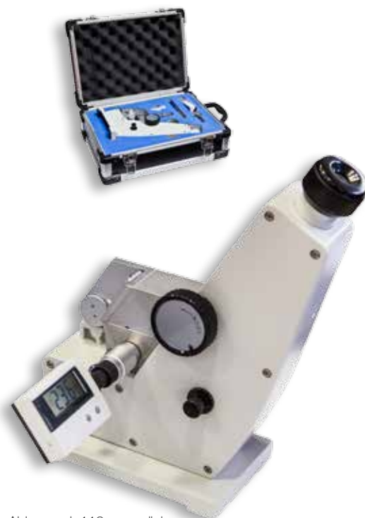
Abbe mod. 110 con valigia di trasporto