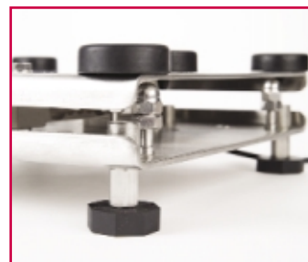
Nessuna filettatura a vista per garantire la conformità agli standards delle preparazioni alimentari e minimizzare le aree di possibile contaminazione