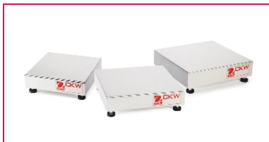
4 portate per 3 misure di piattaforme