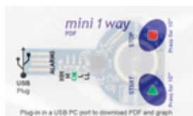
mini 1 way Cod: 70101003