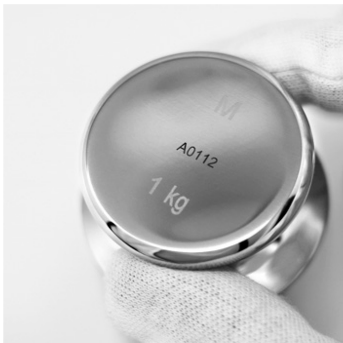
Esempio di marcatura laser opzionale