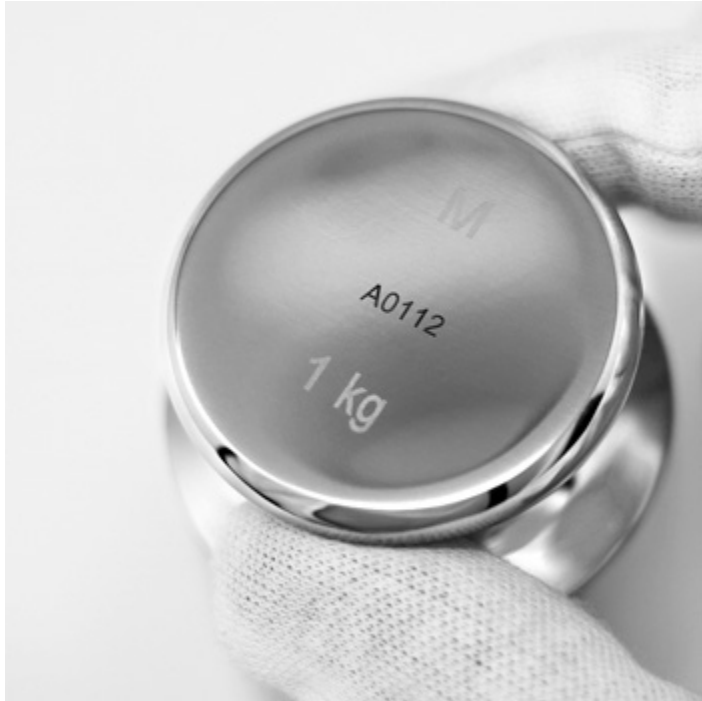
Esempio di marcatura laser opzionale